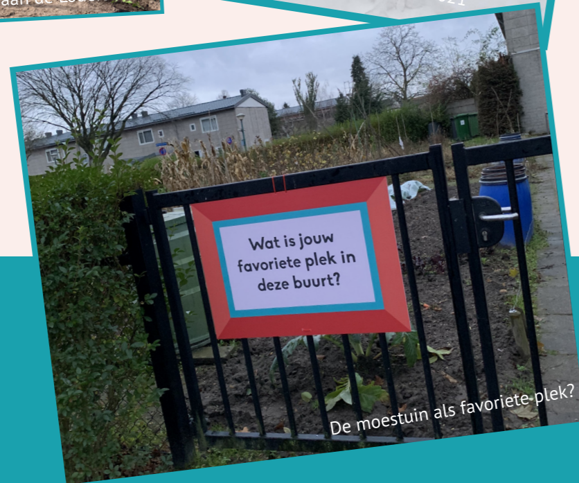
De moestuin als favoriete-plek?

Heb jij nog foto's van leuke activiteiten of andere herinneringen uit de buurt? Stuur ze in en misschien worden ze onderdeel van de buurtwandeling! Kijk op de achterkant van dit krantje voor contactgegevens.