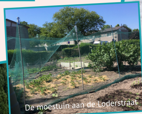
De moestuin aan de Loderstraat