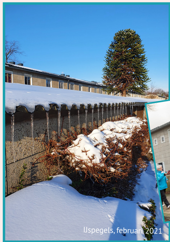
IJpegels, februari 2021