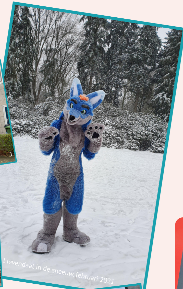
Lievendaal in de sneeuw, februari 2021