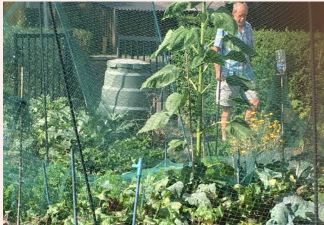
De groentenhof in de zomer vol met groenten

courgettes, rode en witte kolen, rode bieten, wortelen, kruiden en bloemen groeien.” En tijdens de oogst kunnen ze proeven hoe groenten uit de Lievendaalse grond smaken! Heel leerzaam en lekker.