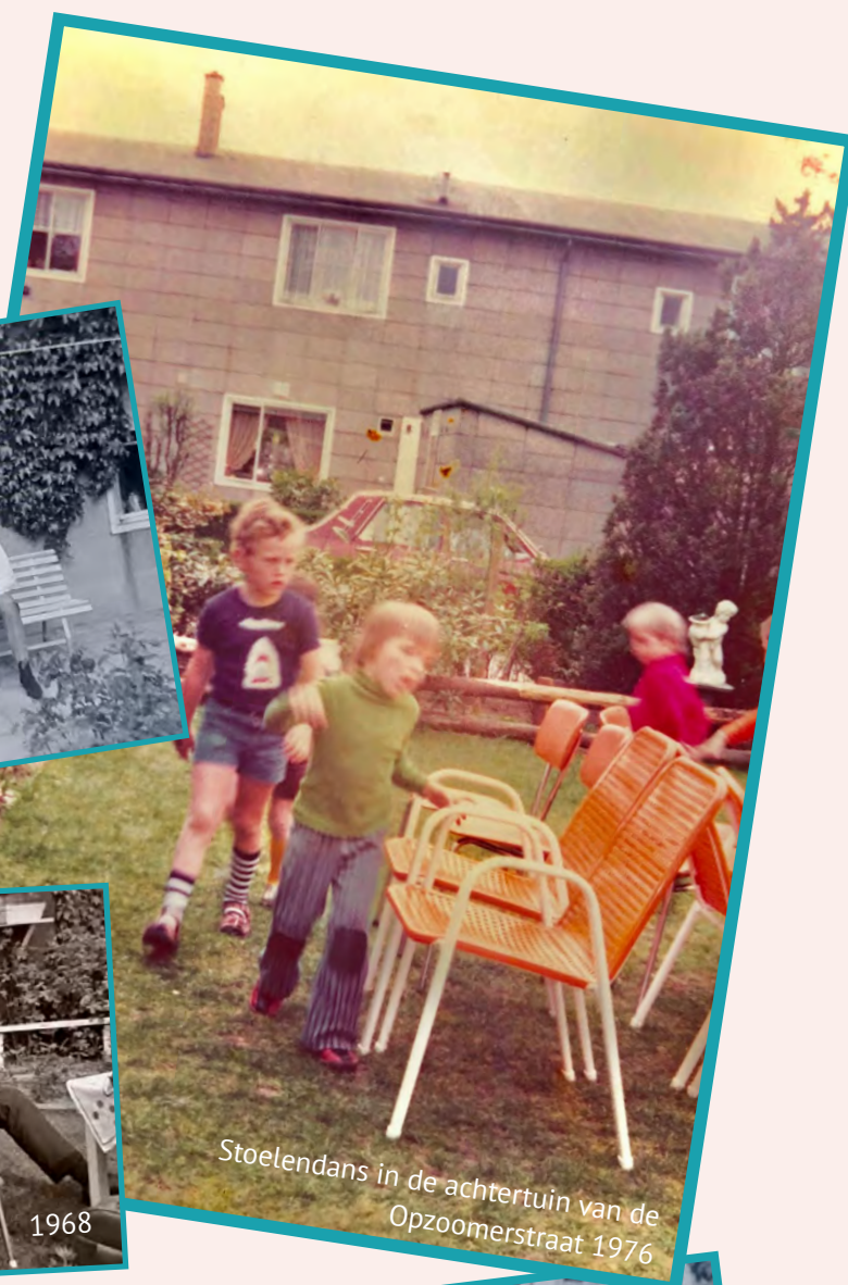
Stoelendans in de achtertuin van de Opzoomerstraat 1976